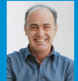
Martin Unterkircher Organisation